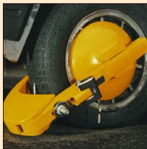
Sabot Universel #1 Immobilisateur de roues pour automobiles.