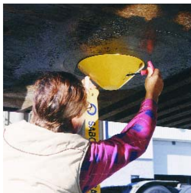
SERRER AVEC LA CLEF ALLEN ET FIXER SOLIDEMENT AU PIVOT.