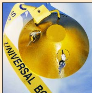
Sabot Universel #8D Deux serrures pour plus de sécurité.