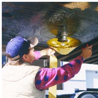
GLISSER LE SABOT SUR LE PIVOT D'ATTELAGE DE LA SEMI-REMORQUE.