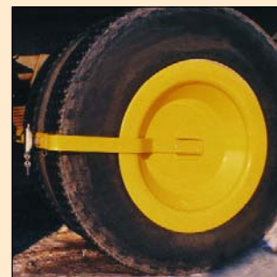
Sabot Universel #3 Immobilisateur pour camions à roues doubles.