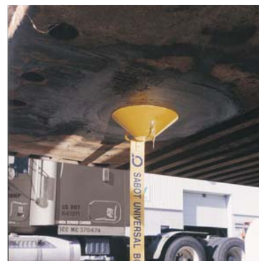
INSÉRER LE CYLINDRE, VERROUILLER, RETIRER LA CLEF DU CYLINDRE.