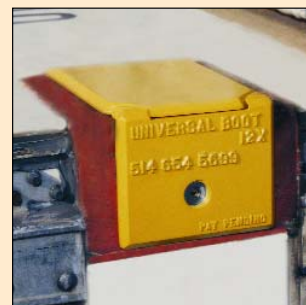
Sabot Universel #12 Protection anti-soulèvement pour conteneur.