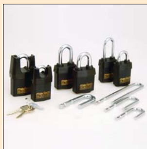
Cadenas Universel #9 Cadenas haute sécurité Medeco.