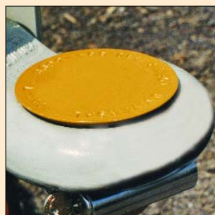
Sabot Universel #7 Dispositif de sécurité pour remorque avec œillet.